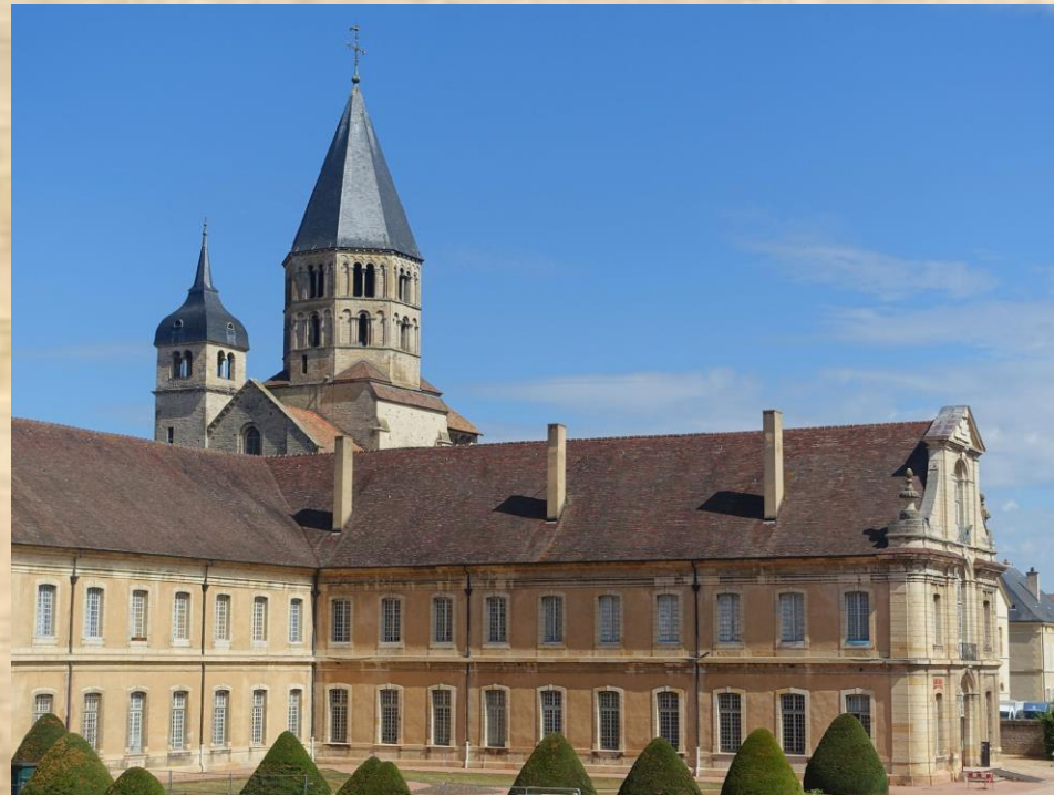
Abtei Cluny 2020

Gründung: Abtei von Cluny in Burgund 910 als Benediktinerkloster mit Berno von Baume als Abt